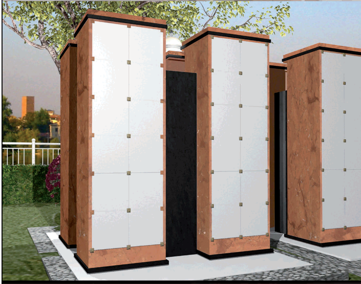
Ossari e cinerari