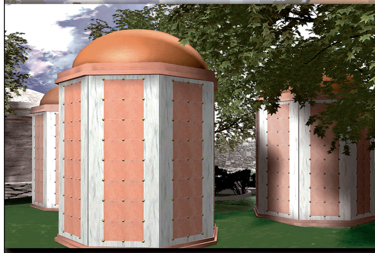
Ossari ad isola

Le strutture sono autoportanti, certificate e fornite di garanzia, non hanno bisogno di manutenzione, se non l'ordinaria pulizia, ed offrono una soluzione velocissima al bisogno di cellette ossario o cinerario. Lo staff LASTELLA SISTEMI® a disposizione per qualsiasi richiesta di intervento, sopralluogo e preventivo gratuiti.